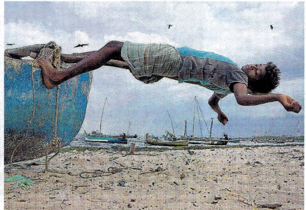
« Comme un oiseau », d'Emmanuel Smague.

Expo, tous les jours jusqu'au 3 janvier, à l'Imagerie, sauf les 25 décembre et 1 er janvier, de 14 h 30 à 18 h 30, les jeudis aussi de 10 h à 12 h. Entrée libre.