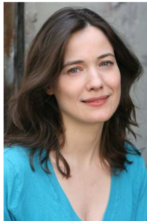
Valérie Théodore Actrice/réalisatrice